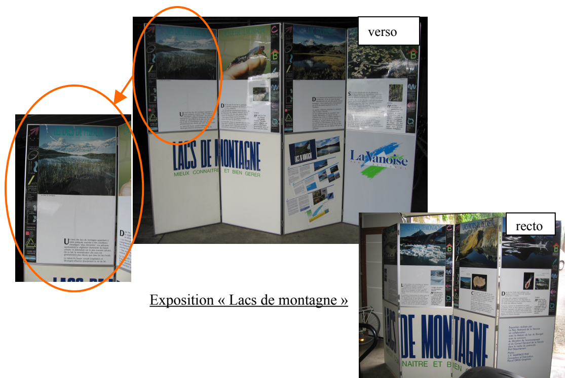
Exposition « Lacs de montagne »